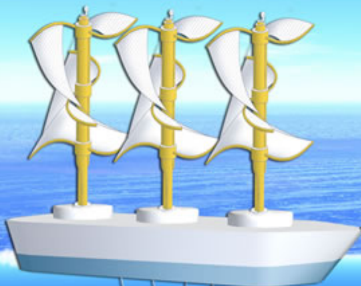
▲波力発電兼エネルギー運搬船