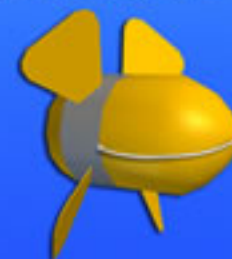
▲係留スクリュウ型海流発電装置