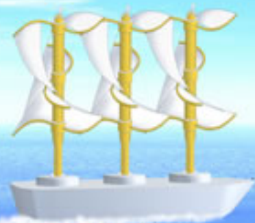
▲波力発電兼エネルギー運搬船